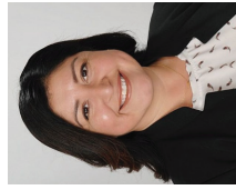
Estimado vecino de Berryessa,

¡Bienvenido de nuevo a la escuela! Con miras a otro año increíble, estamos agradecidos de tener un equipo de maestros y personal tan dedicados y listos para trabajar con nuestros estudiantes sobresalientes. Estamos orgullosos de la enseñanza y aprendizaje innovadores que ofrecemos a nuestros estudiantes aquí en el corazón del Valle del Silicón. Nuestros maestros son de los mejores y ofrecen una experiencia excelente de aprendizaje para nuestros estudiantes, desde el Pre-Kindergarten hasta el 8.º grado, ayudando a garantizar que tengan una base sólida para tener éxito en la secundaria, la universidad y más adelante.